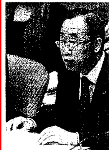
El secretario general de la ONU.

El secretario general de la ONU, Ban Ki-moon, pidió ayer a los países vecinos de Irak que mantengan abiertas sus fronteras para ayudar a los miles de iraquíes que cada día abandonan su nación por la violencia sectaria.