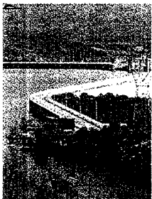
Embalse de El Grado, en Huesca.

EFE/ Las lluvias caídas en diferentes zonas de España en la última semana han hecho que el nivel de los embalses siga aumentando hasta situarse en 33.692 hectómetros cúbicos, un 62,2 por ciento de su capacidad total (54.148). Según el Ministerio de Medio Ambiente, los embalses han aumentado sus reservas desde la semana pasada en 665 hectómetros cúbicos (un 1,2%).