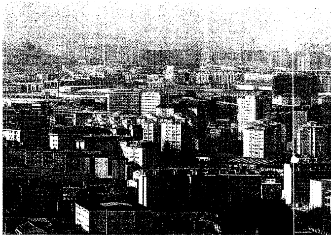
El nivel de emisiones de España se sitúa aún muy lejos de lo que le permite el Protocolo de Kioto.

Las emisiones de gases de efecto invernadero (GEI) descendieron en España un 4,1% en 2006, el mejor resultado desde el año 1990. Solo en 1994 se registraron cifras similares de reducción, pero lo que diferencia a 2006 ha sido el importante crecimiento del PIB (3,9%) y del empleo, lo que hace que la reducción sea más relevante y pueda calificarse de "histórica". A pesar de este dato alentador -incluido en el informe anual sobre la evolución de las emisiones de GEI en España de CCOO- nuestro nivel de emisiones se sitúa aún en un 48,05% más de lo permitido por el Protocolo de Kioto para frenar el cambio climático.