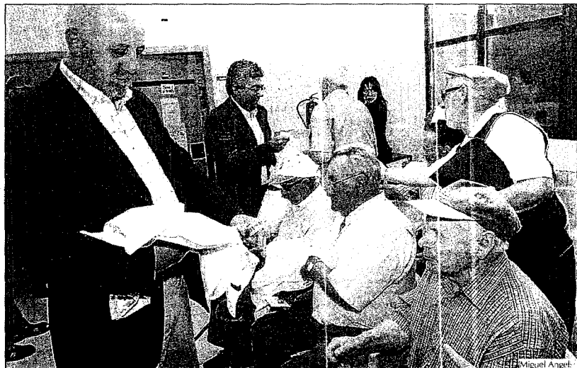
Monedero reparte chalecos reflectantes a los asistentes a la charla en el centro de salud.

La iniciativa se enmarca dentro del Plan de Seguridad Viaria de Galicia.