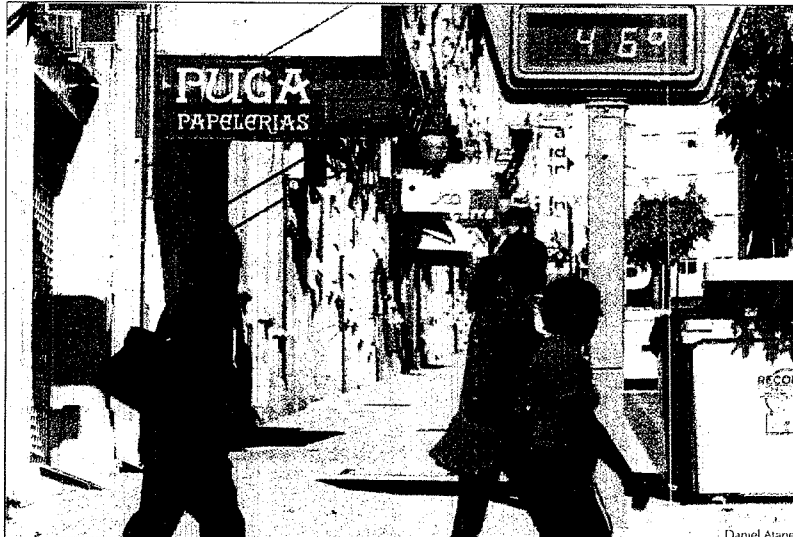
El termómetro ubicado en la calle Capitán Eloy marcaba 46 grados en la tarde de ayer.

Las zonas fluviales, las piscinas, helados, abanicos y unas más que codiciadas sombras fueron la alternativa de frescos para los