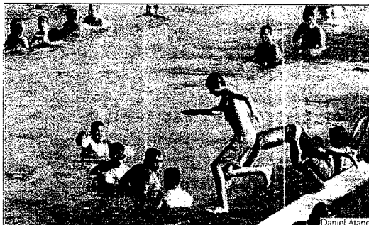
Las piscinas de Oira estaban llenas.

No obstante, el comienzo de semana no supondrá un descenso de las temperaturas. Según las predicciones del Instituto Nacional de Meteorología para hoy, habrá temperaturas "significativamente altas" en la mitad sur peninsular, zona centro, suroeste de Castilla y León, Canarias y Ourense (máxima de 36 grados y mínima de 16). El cambio podría producirse el miércoles.