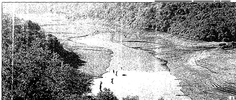
Aspecto que ofrece el río Conso en la cola del embalse del Bao, cerca del pueblo de Viana.