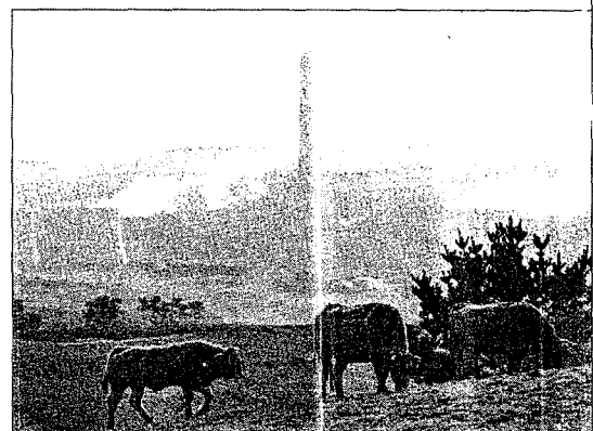
La central térmica de As Pontes es la más contaminante.

Al margen de las eléctricas, el resto de los sectores industriales cumplieron con las cuotas asignadas. La única multa impuesta por la Consellería de Medio Ambiente fue a una empresa que carecía de licencia de emisión. La Xunta ofrece asesoramiento a las pequeñas y medianas empresas afectadas por el protocolo de Kioto y va a premiar el mejor proyecto de reducción de emisiones. Y es que el plan de asignaciones 2008-2013 es más restrictivo que el vigente.