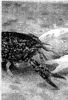
■ El cangrejo americano trajo un hongo que ha causado graves daños en el ecosistema.

especies exóticas; poner en marcha un programa de prevención; regular el comercio y tenencia de estas especies; desarrollar campañas de sensibilización; elaborar un proyecto de ley específico sobre especies exóticas invasoras refundiendo los