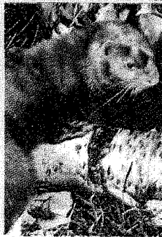
■ El visón americano casi ha acabado con el autóctono español al quedarse su hábitat.