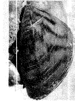
■ El mejillón cebra coloniza los fontos: daños ecológicos, en centrales eléctricas, depósitos.

Ahora, Medio Ambiente se verá forzado, en el plazo de seis meses, a articular la estrategia marcada por la mayoría de los senadores. ¿En qué consiste la propuesta de los populares? Propone siete medidas: aprobar un Plan Nacional para el control de