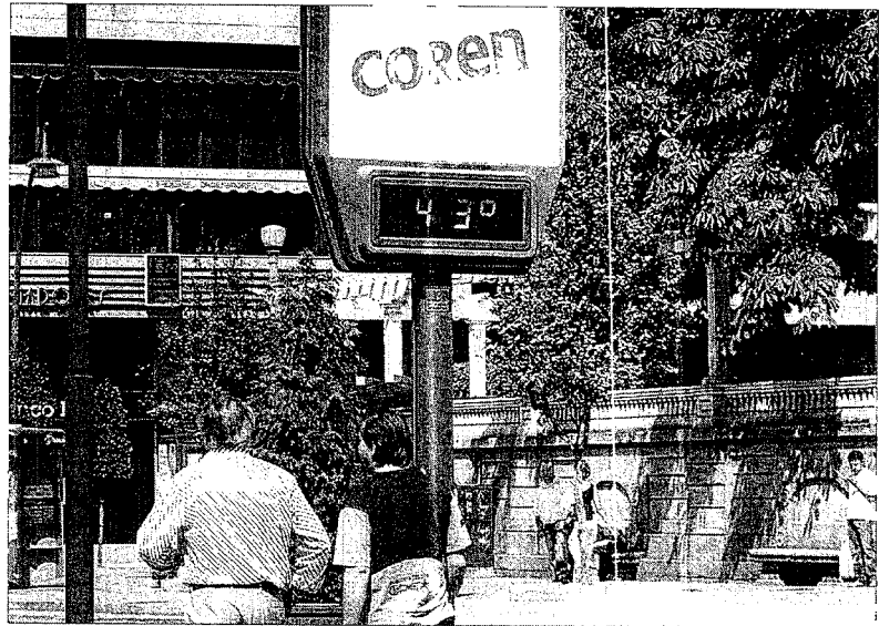
Un termómetro supera los 40 grados en Ourense.

Por otro lado, esta organización cuenta con un servicio de asistencia domiciliaria en la que están inscritas casi 2.000 personas en toda Galicia. Se trata de un sistema mediante el que, con sólo apretar un botón, pueden comunicarse con personal espe-