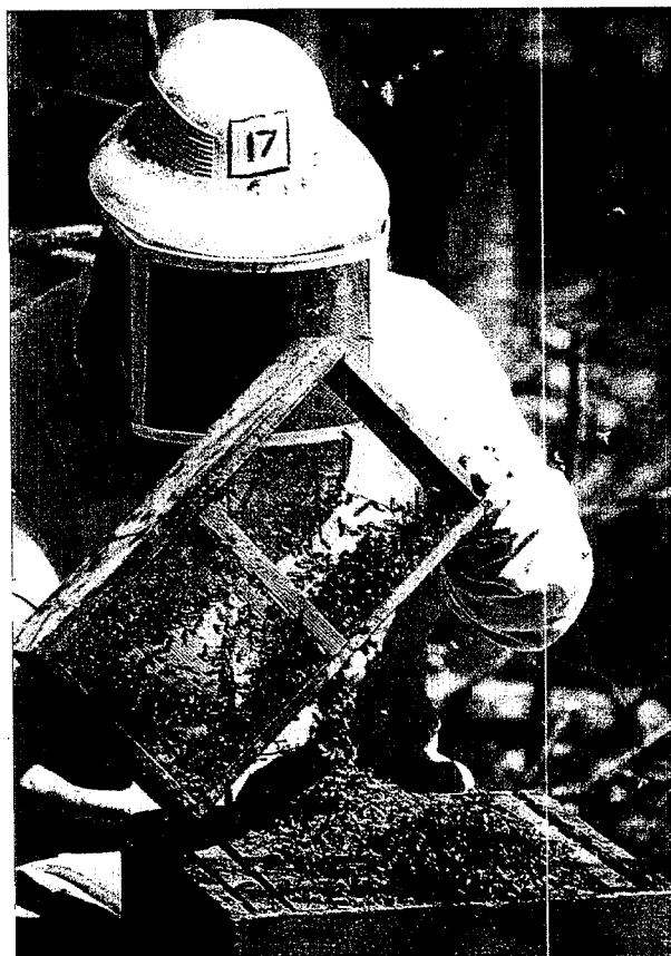
Nuestro país figura como el primero en el censo de colmenas dentro del conjunto de los países de la Unión Europea.

Además, el ministerio ha reservado parte de los 33 millones de euros del programa Apícola Nacional para la investigación de este síndrome del despoblamiento de las colmenas.