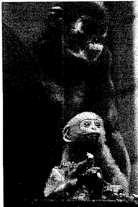
Imagen de un ejemplar de la especie de los langures en un zoo de Filadelfia.

La especie era desconocida hasta que fue descubierta en la década de los 90 del pasado siglo. Actualmente, y en función de la extrema amenaza a la que se enfrentan los monos en Vietnam, ya se han iniciado una serie de programas de rescate en centros que acogen a esa especie y a otras como, por ejemplo, el langur de cabeza dorada.