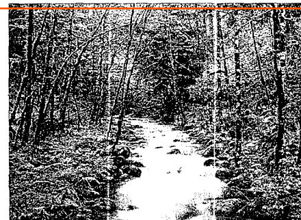
Según el documento, los ríos gallegos necesitan un plan urgente de repoblación de un millón de truchas autóctonas.

El diputado recordó que el año pasado Galicia quedó "literalmente abrasada" por los incendios que asolaron alrededor de 100.000 hec-