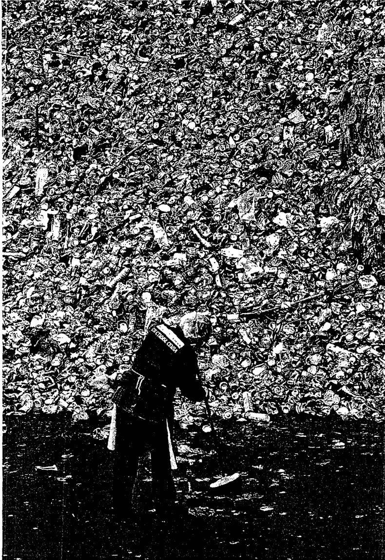
La recogida de residuos se incrementó en todas sus modalidades

El informe de Ecoembes asegura que los que menos contribuyen al reciclaje son hombres de hasta 39 años, que viven en grandes ciudades, que no se preocupan por el futuro y que trivializan sobre este problema. De hecho, según el trabajo, lo consideran un esfuerzo inútil y admiten coartadas para no reciclar. El estudio desvela que el 59% de los habitantes de la