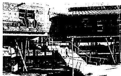
Aulario de Enric Miralles en el campus