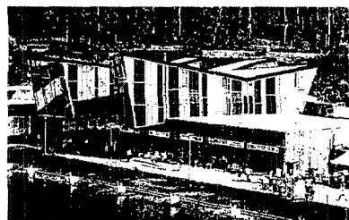
Centro de piragüismo en Verdúcido