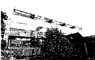
Colegio de los Milagros, de Luis Laorga | MIGUEL VILLAR