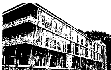
Oficinas de la central de Belesar | ALBERTO LÓPEZ

deportivo de Verdúcido, proyectado por José Ramón Garitano, y el campus universitario de Vigo (Miralles, Penela, Santos Zas...), un urbanismo abierto, disuelto en el paisaje, en el que los espacios libres envuelven la arquitectura.