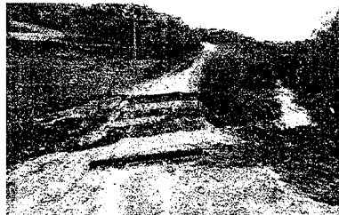
Un pueblo incomunicado. La caída del puente de Vilar do Paraíso (Dumbria) fue una de las imágenes más espectaculares de las riadas. El inmenso hueco en la carretera dejó varias semanas incomunicados entre sí a varios núcleos.