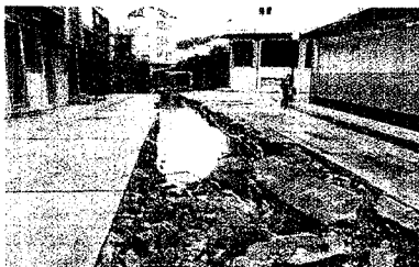
Un cuello de botella. El lavadero de Maadrián, el punto en el que el río Ferrol, a su paso por Cee, comenzaba su camino subterráneo, fue uno de los epicentros de los destrozos. Las tuberías no pudieron canalizar tanta cantidad de agua.

los vecinos de Cee logren una compensación económica por los daños de las riadas.