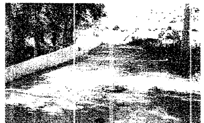
Pendiente de asfaltado. Las actuaciones permitieron devolver el río a su cauce, apuntalado ahora con hormigón para que no lo abandone. Los huecos de la carretera fueron cubiertos, pero falta aún el asfaltado de la vía.