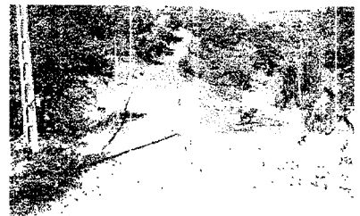
Una solución mejorada. La Xunta atacó las obras del puente casi de modo inmediato. Hace meses que está terminado. La solución además, permitió ampliar el espacio para el paso del agua en caso de crecida.