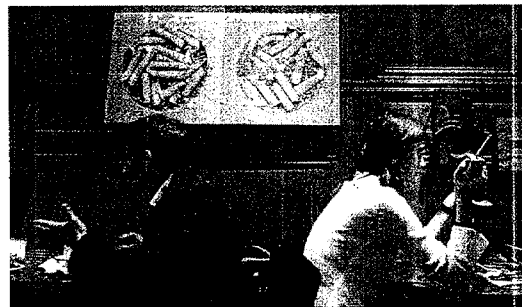
El Café 203 de Lyon ha decidido incumplir la norma antitabaco

El partido entiende que «por norma tanto las administraciones de las comunidades autónomas como los ayuntamientos se han negado a velar por la salvaguarda de aquellos espacios que, por ley, deberían estar libres de