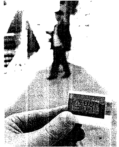
A las 14.15 horas había 19° y un 44% de humedad

Y si en la villa proliferan las terrazas, en el campo lo hacen las barbacoas, alternativa de interior a las playas, tan concurridas estos días en muchos puntos costeros de Galicia.