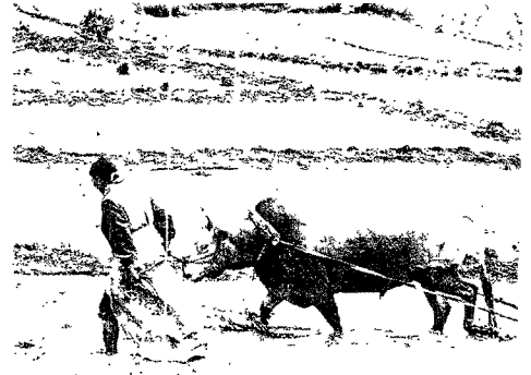
El campesinado chino apenas dispone de medios mecánicos

Pese a la gravedad del problema, los organismos internacionales no se ponen de acuerdo sobre el origen del mismo. Así, la Comisión Europea presentó a finales de junio un informe en el que negaba cualquier relación entre el biodiésel y la cesta de la compra. Según el Ejecutivo comunitario, la producción de cereales para la industria de los combustibles limpios será una salida marginal para las cosechas, al menos hasta que en el 2010 entre en vigor las obligaciones impuestas por Bruselas. La Organización para la Cooperación y el Desarrollo