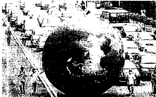
En Indonesia, donde será la próxima cumbre, ya hay protestas

¿Qué es lo que se ha acordado? A falta de los detalles que se concretarán hoy, de momento ha trascendido que el documento