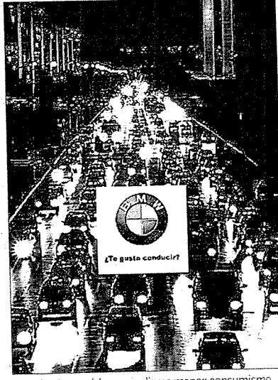
A contrapublicidade é a principal arma do portal 'Consume hasta morir' para pedir un menor consumismo