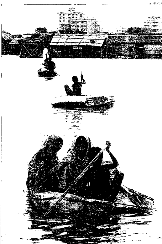
Vítimas das inundacións buscan unha saída en barcas en Bangladesh

A situación mellorou nas últimas horas en Nepal, onde o número de mortos ascende a 93. ●