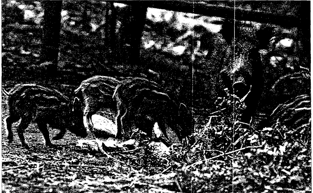
Unha femia de xabaril con tres xabatos no bosque de Ridimoas, trescentas hectareas preservadas por un milleiro de propietarios

O profesor e naturalista é a clave nese equilibrio xa que, segundo explicou, encárgase persoalmente de negociar cos agricultores para comprarlles as parcelas para estender o