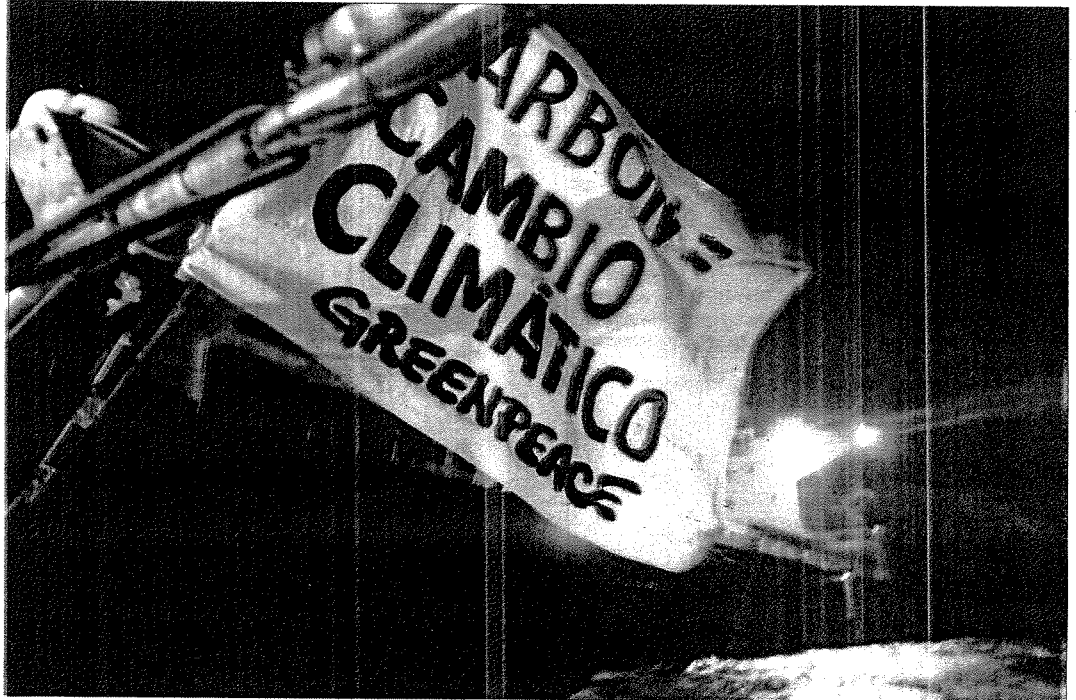
ACTIVISTAS DE GREENPEACE DURANTE A ABORDAXE, ESTE LUNS, DO BUQUE 'WINDSOR ADVENTURE', CON 54.000 TM DE CARBÓN