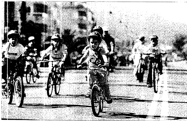
Imagen de una marcha ciclista celebrada en San Paio de Navia. I MIGUEL NÚÑEZ

La implantación del llamado bicing era había sido iniciada por el anterior gobierno, que convocó varios concursos para adquirir cien bicicletas, comprar las plataformas de recogida y entrega, y