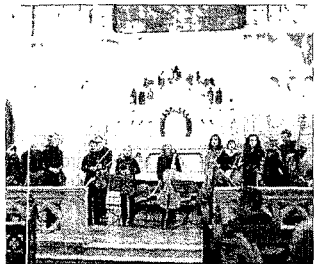
La Orquesta de Cámara Galega, actuando.

La Orquesta de Cámara Galega acaba de finalizar su gira de conciertos por Argentina, que ha durado todo este mes, y que ha supuesto un gran éxito de público. Se calcula que más de 3.000 personas han asistido a los cinco conciertos que la formación musical ha ofrecido en los diversos puntos del territorio argentino interpretando obras de compositores gallegos.