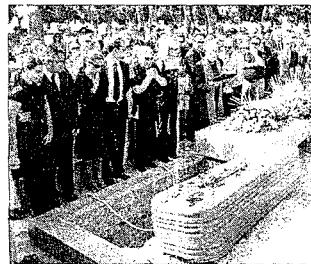
Un momento del entierro.

Familiares y amigos de Emma Penella, entre los que se encontraban una gran representación del mundo de la cultura, acudieron ayer al cementerio de La Almudena de Madrid para dar el último adiós a la actriz, en una ceremonia que también contó con la presencia del ministro de Cultura, César Antonio Molina, quien afirmó acudir "en homenaje a una gran artista".