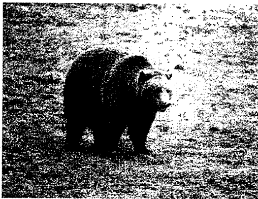
O oso é un dos mamíferos que está en perigo de extinción na comunidade galega. > LV

Precisamente para protexer unha destas especies que están en perigo, o oso, a Confederación Hidrográfica do Norte e a Fundación Oso Pardo asinaron un convenio de colaboración para mellorar o seu hábitat nas cabeceiras dos ríos.