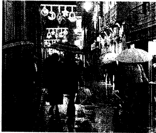
La lluvia volvió ayer a Lugo, pero sigue siendo escasa

En tanto, las previsiones apuntan a que durante los próximos días va a seguir lloviendo, lo que permitirá también que se vayan recuperando acuíferos de la zona rural, de los que dependen muchos vecinos.