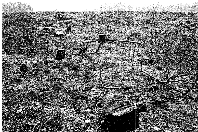
La administración autonómica y la universidad implantaron un sello de calidad para plantas de repoblación

nes. A la ejecución de este programa se destinarán cerca de 500.000 euros, según los datos del Ministerio de Medio Ambiente, que indica que el Programa de Voluntariado en Ríos es, además, un instrumento para transmitir a los ciudadanos, grupos sociales y diferentes entidades un sentimiento de responsabilidad compartida sobre el entorno natural, de