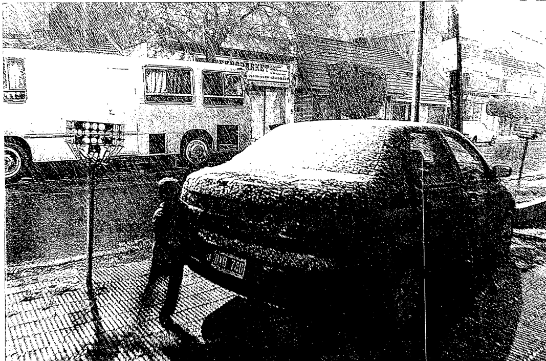
Un niño juega bajo la nevada que cayó en Buenos Aires el pasado mes de julio; algo que no ocurría desde hace 89 años.

El agua ha caído con furia en casi todos los rincones del mundo. China: 13,5 millones de afectados y más de 120 muertos. Omán: 20.000 damnificados y más de 50 fallecimientos. Sudán: el desbordamiento del Nilo arrasó 16.000 viviendas. Uruguay: las peores lluvias en medio siglo perjudicaron a 110.000 personas. Todo esto, entre mayo y junio. Antes, países como Mozambique sufrieron las inundaciones más graves de los últimos tiempos. Allí el agua ahogó 30 vidas y