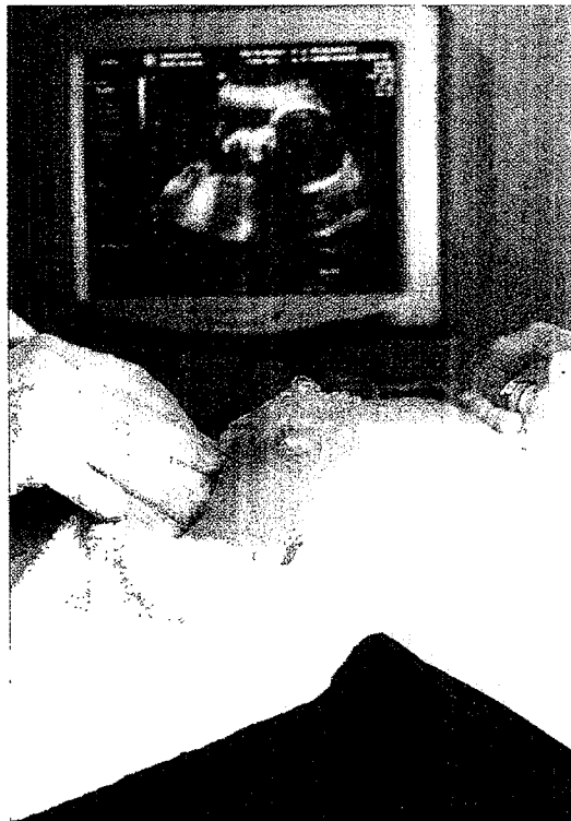
Una mujer embarazada se somete a una ecografía.

están en situación de desamparo. A partir de ese momento, el IMMF hace de padre y de madre de los chicos. Y, como los progenitores, tiene que autorizar el aborto cuando alguna de sus hijas lo pide, siempre y cuando se cumpla alguno de los supuestos de despenalización previstos en la ley: violación, malformación fetal o grave riesgo para la salud física o psiqui-