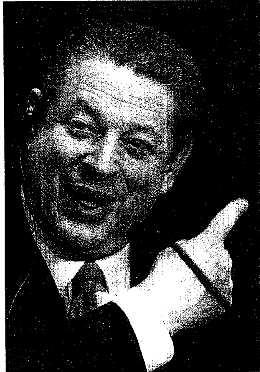
Al Gore, ayer, durante su intervención en Oviedo.

El líder del PP, Mariano Rajoy, se reafirmó ayer en su postura esceptica con los efectos del cambio climático, en una intervención en