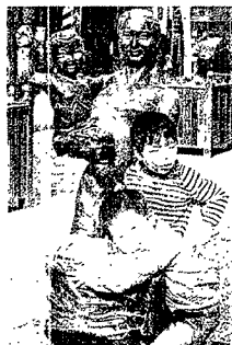
Tracer un hermano seguirá saliendo caro en China.