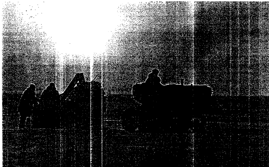
Ingenieros rusos en una estación en el Polo Norte arrastran mercancía con un tractor a través del hielo.