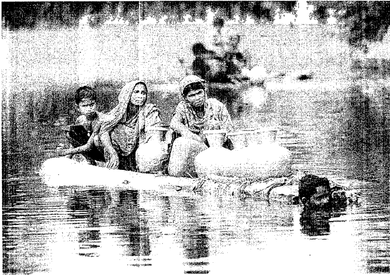
La mitad del país se encuentra incomunicado y sin acceso a comida y agua potable