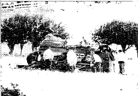
Investigadores policiales examinan los restos del helicóptero

■ En Tezno, al norte de Eslovenia, investigadores han encontrado una fosa común que podría ser una de las más grandes de Europa, con los restos mortales de unas 15.000 víctimas de la II Guerra Mundial, informó "Delo" de Liubliana. La fosa es de un kilómetro de longitud y está llena de huesos hasta 1,5 a 2 metros de profundidad.