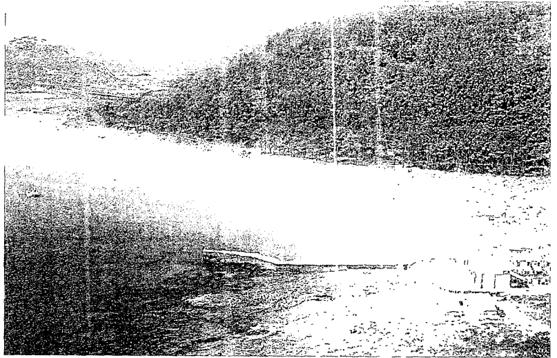
Vistas de las islas Cíes, situadas en la ría de Vigo, incluidas en el Parque Nacional Illas Atlánticas

La accesibilidad es otra deficiencia que deben mejorar los parques españoles. Sólo uno de