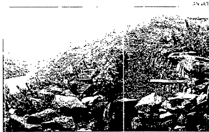
Cañones del Sil Son uno de los mejores ejemplos que muestran cómo la acción del hombre, a través de cultivos como la vid, modifica el paisaje.

Precedente ▶ Los ecologistas denuncian que ya en la Ley de Turismo se incidía en la protección del paisaje, pero pese a existir legislación al respecto no se aplicó nunca en la práctica