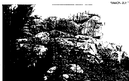
Penedos de Pasarela-Traba Estas atípicas rocas empezaron a crearse en el Terciario por fracturación de la roca. Galicia tenía un clima tropical entonces.