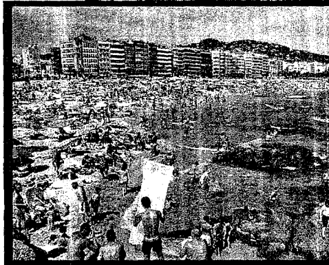
Reducir las emisiones contaminantes, luchar contra los incendios y trabajar por un urbanismo responsable son prioridades medioambientales. ALGOMBURG