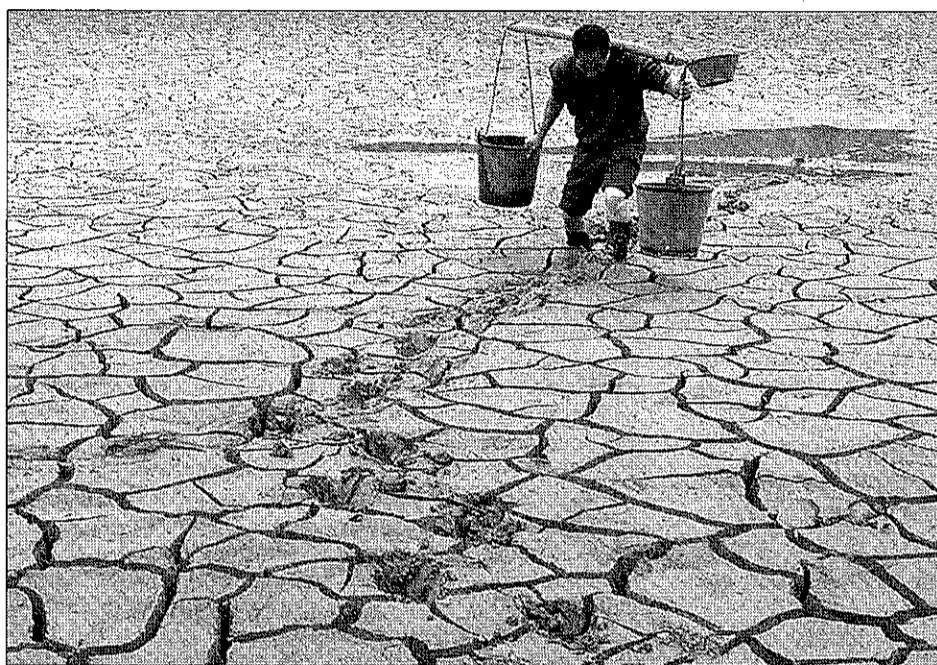
Un hombre recoge agua de una charca casi seca en la provincia china de Jiangxi.

Por ello, a la ONU le preocupa que afloren nuevos conflictos internacionales derivados del peligro medioambiental y augura que la falta de recursos se convertirá en una amenaza para la seguridad internacional. "De no hacerse nada, viviremos una guerra civil mundial", sentencia este organismo. Mientras en Oslo el ex vicepresidente