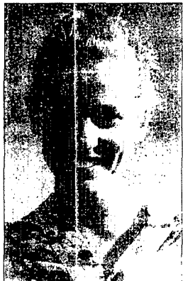
La actriz María Vázquez.