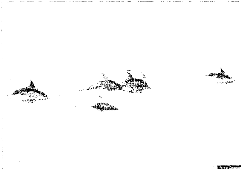
Un grupo de delfines avistado por la expedición que realizó Cemma al "Banco de Galicia" en 2006.

Los informes elaborados por Cemma fueron remitidos al Ministerio de Medio Ambiente, con el fin de reclamar protección para esta área marina que consideran de especial interés.