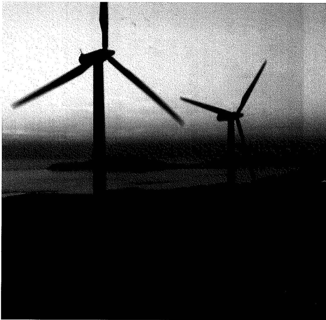
Alto de Paxareiras -por riba de Carnota- con Fisterra ao fondo.

Endesa e a multinacional xaponesa Eurus (que posúe a metade das accións de Norvento, unha das promotoras eólicas con parques en funcionamento en Galiza) optaron pola vía xudicial para evitar que lles sexan revocadas as súas concesións. A Consellaría que dirixe Fernando