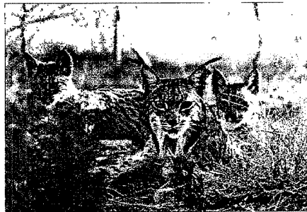
Un grupo de cachorros de lince ibérico