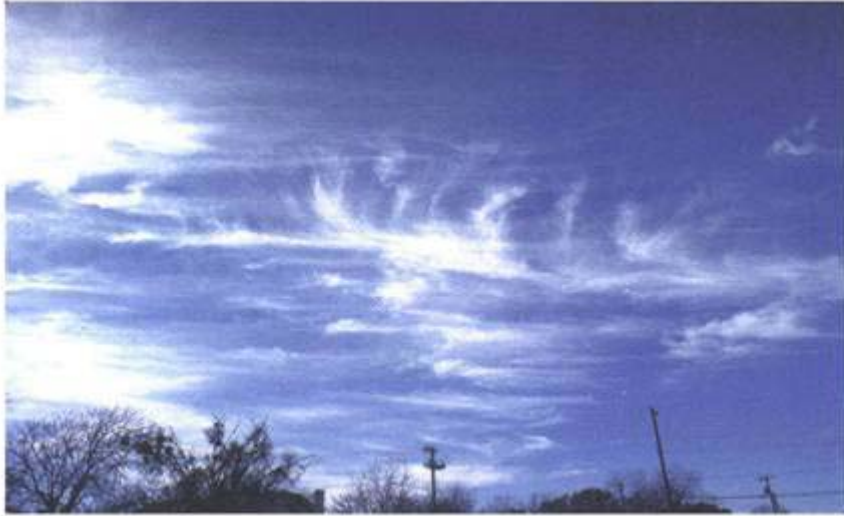
Figura CT-AC-9 (foto 5)