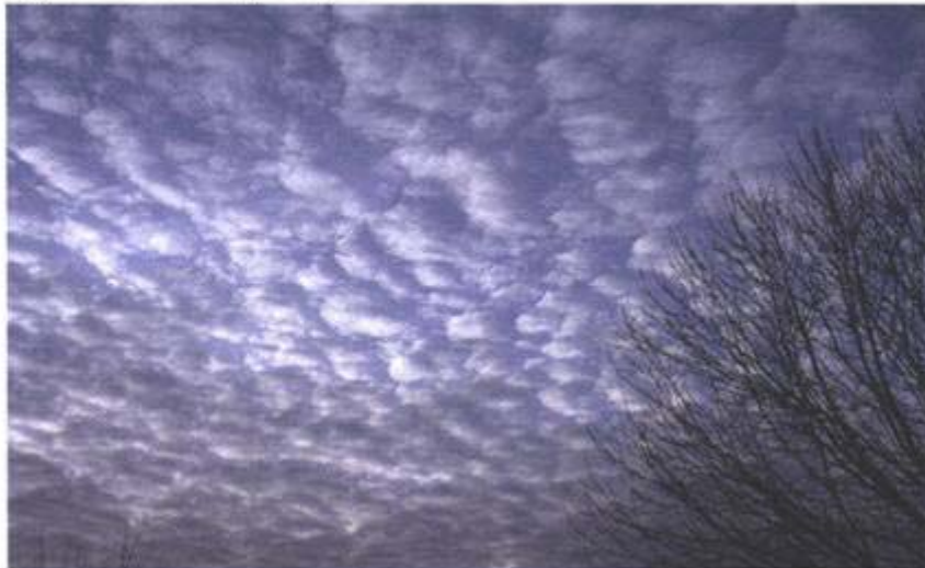
Figura CT-AC-11 (foto 7)