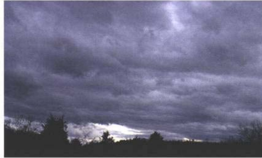
Figura CT-AC-10 (foto 6)